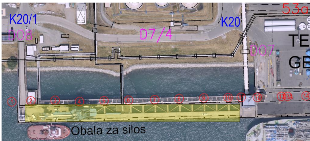
Slika 1: Območje izvedbe (označeno z rumeno)

Lokacija izvedbe: Luka Koper d.d., Terminal za sipke towore – Sanacija verižnega transporterja in galerije silosa