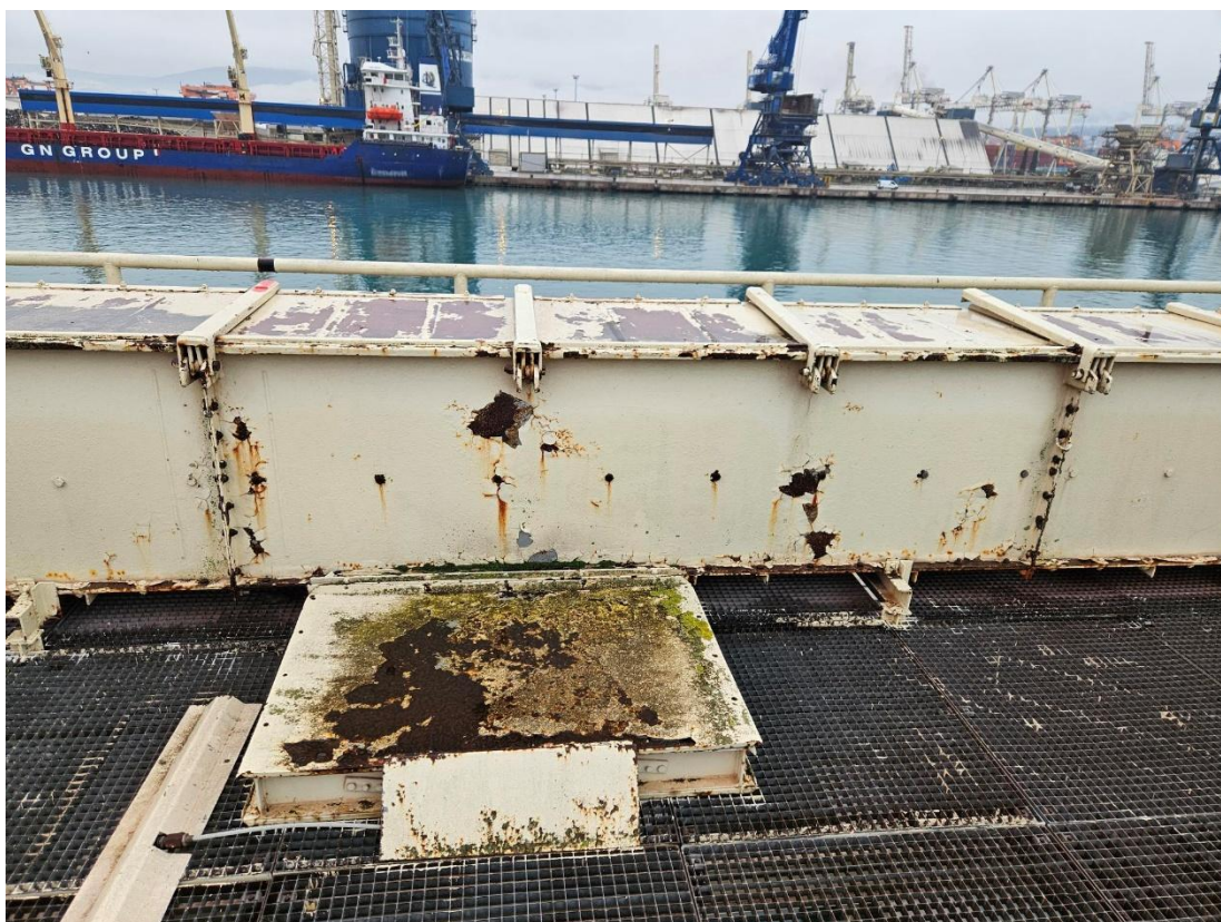
Slika 4. Prikaz stanja konstrukcije verižnega transporterja