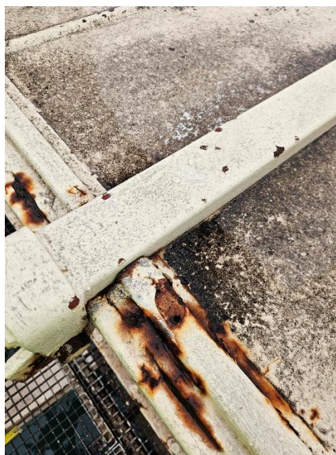
Slika 2. - 3. Prikaz stanja pokrovov pnevmatskih zapirac̑ev in zgornje prekorodirane pločevine