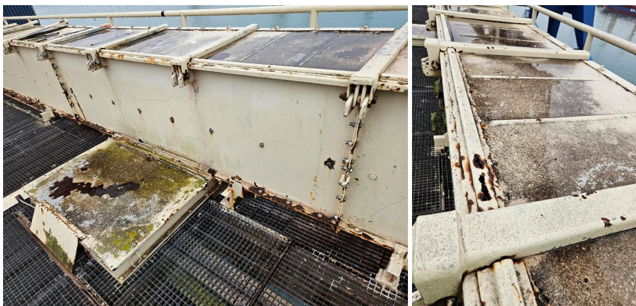
Slika 5. - 6. Prikaz stanja konstrukcije verižnega transporterja